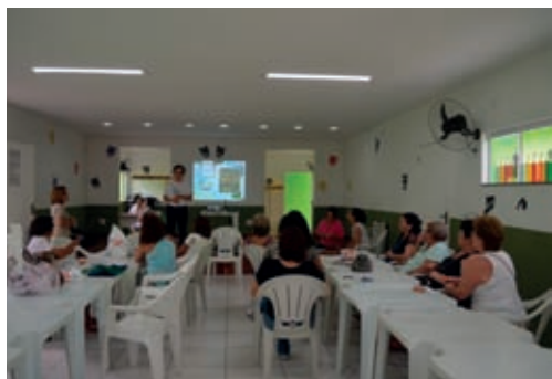
Fig. 17 – Mulheres da comunidade de Monte Alto, assistindo a apresentação sobre a restinga de Massambaba.