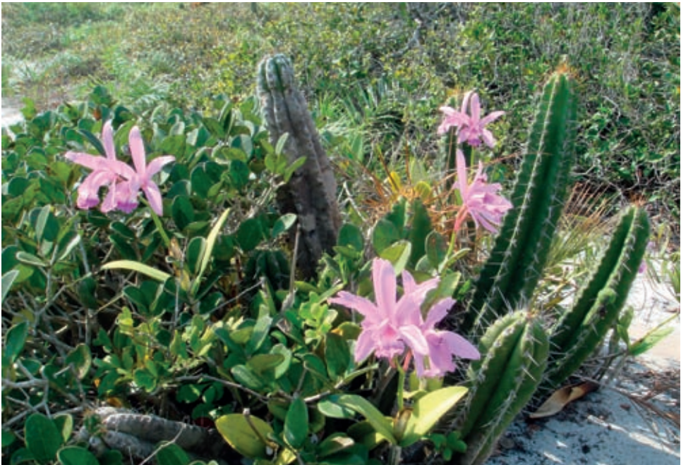
Fig. 8 – A bela Cattleya intermedia crescendo entre cactus e clusia.

Na área da “Rebio das Orquídeas” encontra-se uma população de Cattleya intermedia Graham ex Hook. e uma população menos densa de Cattleya guttata Lindl., além de outras orquídeas e representantes de diversas outras famílias que ocorrem na rica restinga arbustiva dessa região. Plantas de C. intermedia e C. guttata , que antes ocorriam em outros pontos da restinga de Massambaba e em muitos outros locais do litoral da região Sudeste, hoje são raramente encontradas. No estado do Rio de Janeiro, populações das 2 espécies só são encontradas crescendo juntas na “Rebio das Orquídeas”.