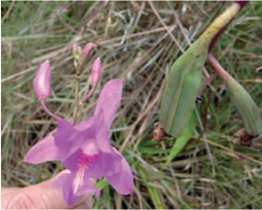
Fig. 4 – Bletia catenulata hoje é só encontrada em uma área bastante restrita.