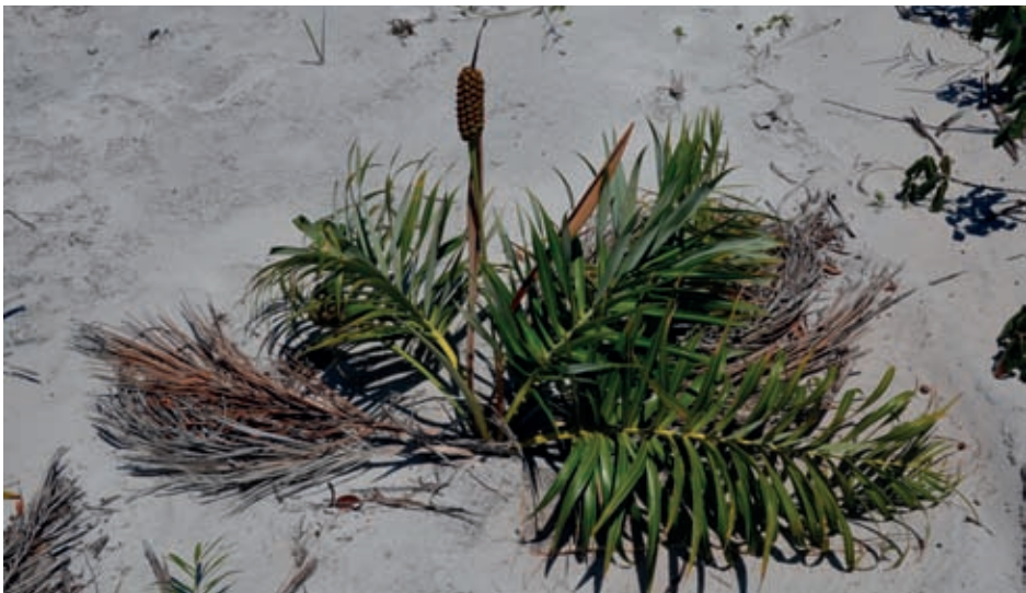
Fig. 5 – A palmeira guriri ( Allagoptera arenaria ) tem papel importante em segurar a areia.

Entre a rica flora da restinga de Massambaba, que alonga-se entre a Lagoa de Araruama e o mar, com partes nos municípios de Arraial, de Araruama e de Saquarema, já foram registradas 28 espécies de orquídeas. A família Orchidaceae é a quinta em número total de espécies que ocorrem nas restingas do estado (Fagnani & Siqueira, 1992; Pereira & Araújo, 2000; Araújo et al. , 2009). Será importante monitorarmos o que resta pois ao longo do PECS populações de algumas espécies já não são encontradas em locais onde antes eram abundantes.