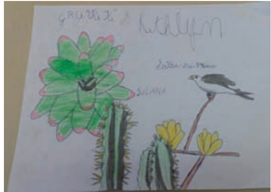
Fig. 22 – Desenho feito em sala de aula por aluno inspirado no material didático distribuído pelo BrBio para as escolas públicas de ensino fundamental de Arraial do Cabo e Cabo Frio.