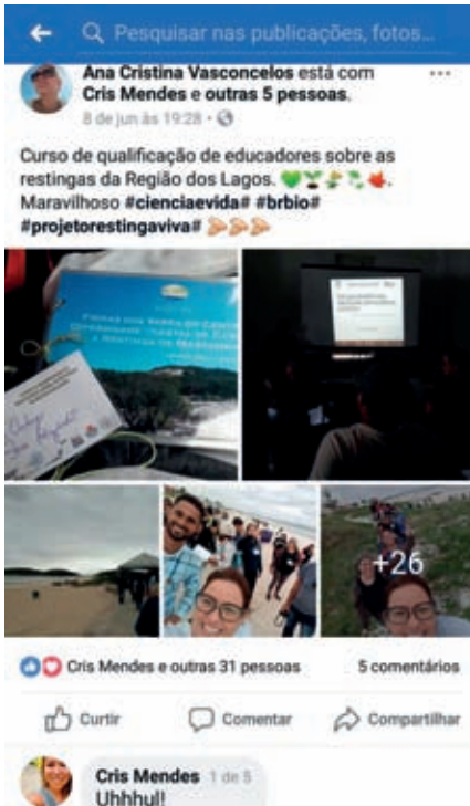
Fig. 21 – Exemplo da repercussão do curso de qualificação dos educadores, divulgada através de mídias sociais, pelos participantes.