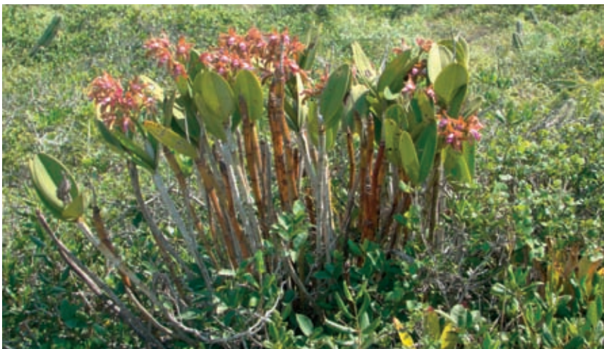
Fig. 10 – No final do verão, algumas plantas de C. guttata floridas se sobressaem nas moitas densas de vegetação. folhas ou na areia descoberta.

Ao longo dos anos, membros da Orquidário têm