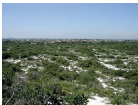
Fig. 3 – Outro ambiente de restinga aberta de moitas, mostrando o limite entre a área urbana e o PECS.