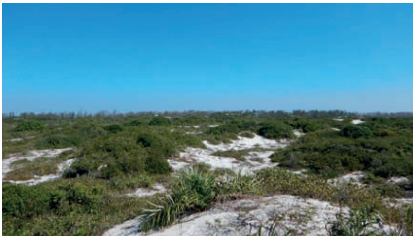
Fig. 2 – Fragmento bem conservado de restinga de moitas da Massambaba. No horizonte, linha da espécie australiana e invasora, Casuarina equisetifolia .

no município de Arraial do Cabo, Região dos Lagos, RJ. A pressão feita por Lema, e apoiada pelos sócios da SBO foi grande! Como desdobramento, em 1989 foi criada a Área de Proteção Ambiental (APA) da Massambaba e, em 2009, estabeleceu-se o Parque Estadual da Costa do Sol (PECS).