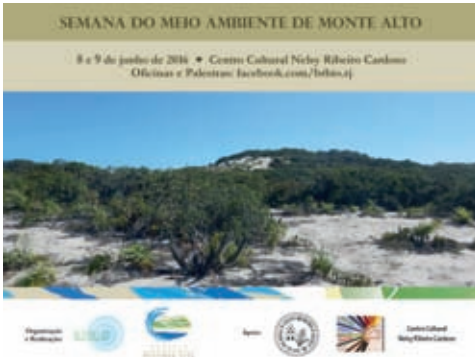
Fig. 14 – Cartaz de divulgação da Semana do Meio Ambiente de Monte Alto, em 2016.