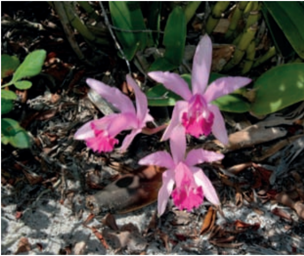
Fig. 9 – C. intermedia cresce aqui em moita mais sombreada. Suas raízes podem estar entre a matéria orgânica das folhas ou na areia descoberta.

Estas duas espécies são endêmicas do Brasil e têm seu valor ornamental reconhecido internacionalmente. Hoje a área da “Rebio das Orquídeas” está também incluída no PECS. Contudo, apesar da proteção legal, falhas nos mecanismos de fiscalização efetiva tornam o ambiente suscetível à ação de caçadores de orquídeas, atraídos pelo valor comercial das mesmas e também ao fogo ocasional e destruidor.