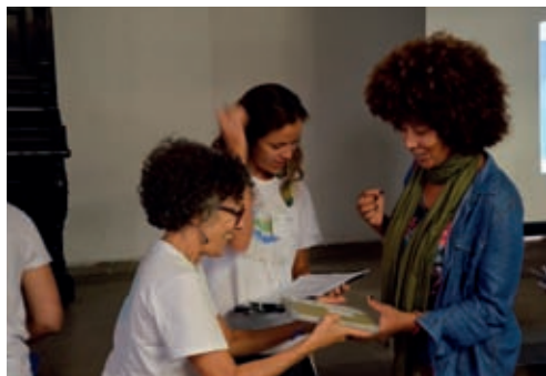
Fig. 19 – Entrega das “Fichas dos Seres do Centro de Diversidade Vegetal de Cabo Frio: a restinga de Massambaba”, material didático publicado pelo BrBio para ser usado na sala de aula e na restinga.