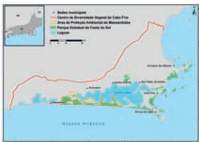
Fig. 1 – Mapa da Região dos Lagos, RJ, mostrando o limite do Centro de Diversidade Vegetal de Cabo Frio e as Unidades de Conservação da Região (mapa elaborado pelo CNCFlora/IPBRJ/MMA).

Key words: Conservation, sand dune vegetation, Cattleya , Arraial do Cabo municipality.