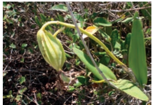
Fig. 13 – A presença do polinizador no ambiente possibilita a fecundação das duas espécies de Cattleya .

A OrquidaRio e o BrBio, como organizações da sociedade civil, são membros do Conselho Consultivo do PECS e propõem-se a colaborar com o INEA na elaboração do Plano de Manejo do PECS, que está em andamento. O mapeamento e monitoramento das populações de orquídeas que ocorrem nesta unidade de conservação está nos planos de alguns dos sócios da OrquidaRio. Para isto, precisarão submeter o projeto ao INEA, para receberem autorização para as pesquisas.