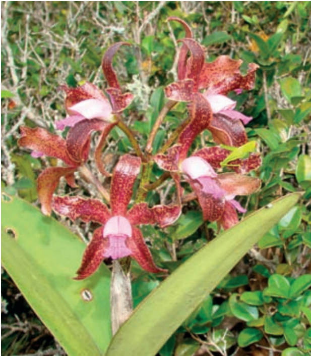
Fig. 11 – A variabilidade morfológica das espécies de Cattleia deve ser mantida no ambiente.

medidas emergenciais para sua efetiva conservação.