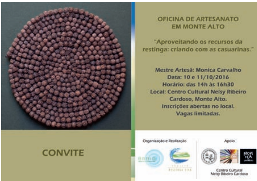
Fig. 16 – Convite para a oficina de artesanato de Monte Alto, a partir do uso do fruto da casuarina, espécie invasora.

Se queremos efetivamente conservar as restingas, o caminho a trilharmos daqui para frente é o da Educação, que é um objetivo importante da Orquidário. Divulgar o conhecimento que se tem sobre o CDVCF e, com os vários atores, encontrar soluções criativas e sensibilizar moradores e turistas sobre a riqueza natural única. Com isto seguimos o que, já em 1992, nossa querida sócia e botânica, Penha Fagnani propagava: “Vamos ficar atentos no sentido da preservação e vitalidade da Restinga de Massambaba, usando nossas capacidades de orquidófilos para restaurá-la e de cidadãos para defendê-la” (Fagnani & Siqueira, 1992).