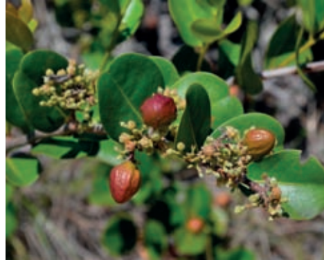
Fig. 7 – O bajurú ( Chrysobalanus icaco ) está entre as plantas tradicionalmente usadas pela população local.

Na área da “Rebio das Orquídeas” encontra-se uma população de Cattleya intermedia Graham ex Hook. e uma população menos densa de Cattleya guttata Lindl., além de outras orquídeas e representantes de diversas outras famílias que ocorrem na rica restinga arbustiva dessa região. Plantas de C. intermedia e C. guttata , que antes ocorriam em outros pontos da restinga de Massambaba e em muitos outros locais do litoral da região Sudeste, hoje são raramente encontradas. No estado do Rio de Janeiro, populações das 2 espécies só são encontradas crescendo juntas na “Rebio das Orquídeas”.