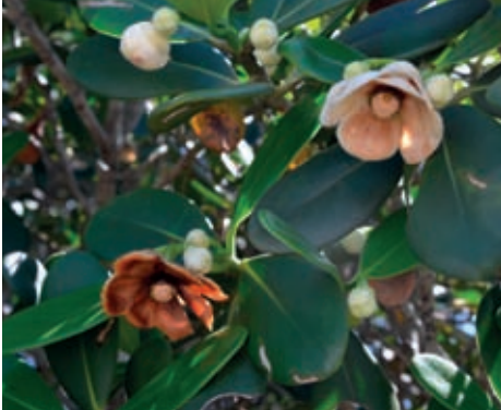
Fig. 6 – Na região ocorre mais de uma espécie de Clusia . Várias outras espécies germinam no ambiente sombreado que se forma embaixo destas árvores.