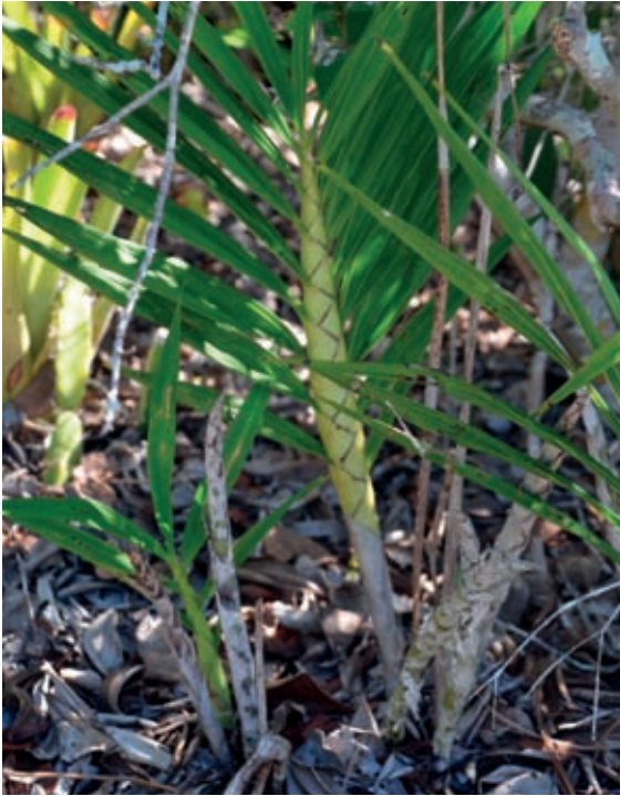
Fig. 12 – Cyrtopodium sp na sombra de uma moita, entre muita matéria orgânica.

O objetivo foi qualificar os educadores para que sejam multiplicadores do conhecimento que se tem sobre as restingas da região. Ao multiplicarem o conhecimento, mais pessoas estarão conscientes de que é necessário conservar as áreas de restinga, sua flora e fauna nativas.